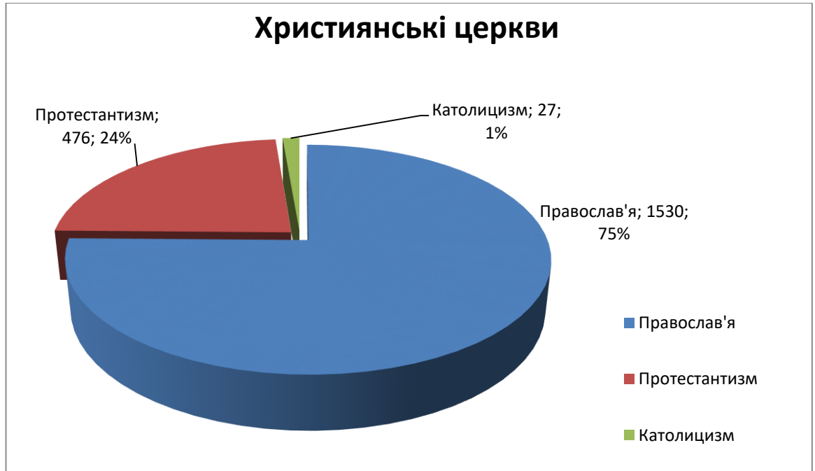
Діаграма 2. Розподіл православних релігійних організацій