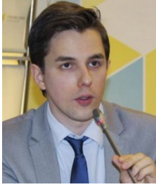
Руслан Кермач, політичний аналітик, «ДІ»